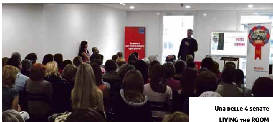
Una delle 4 serate LIVING THE ROOM

Sushi, Tex-mex, Thailandese, Indiana, Cinese